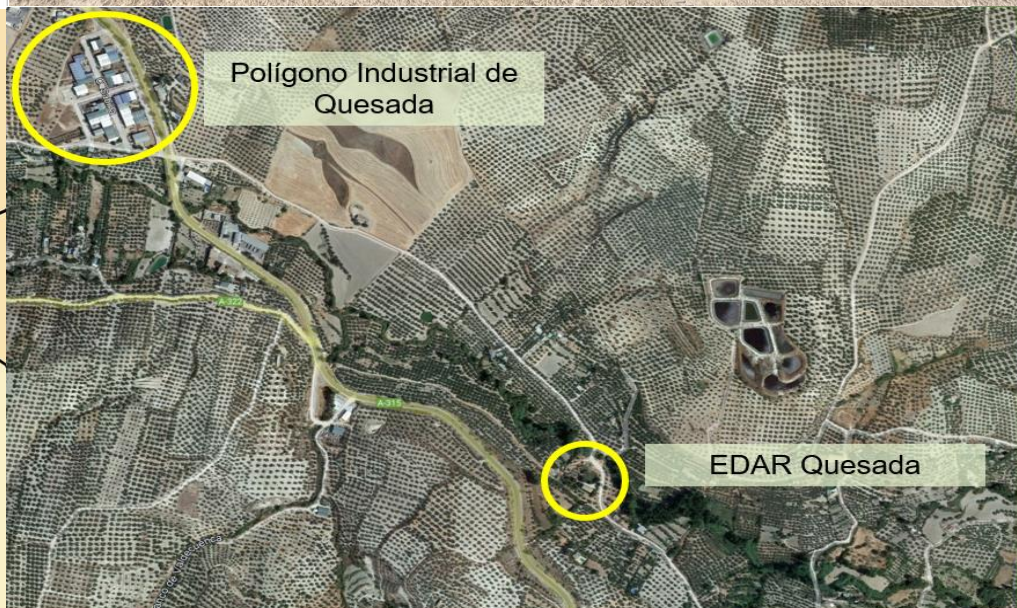
Proyecto de EBAR y conducción de agua desde el Polígono Industrial de QUESADA hasta la EDAR de QUESADA