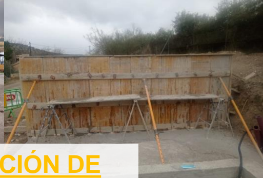
EJECUCIÓN DE LAS OBRAS