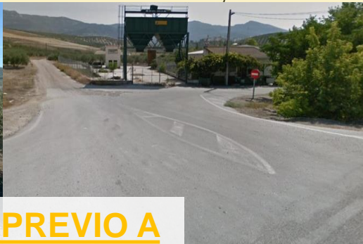
ESTADO PREVIO A LA ACTUACIÓN